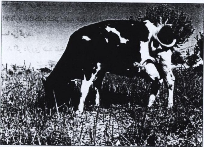
شکل شماره ۴ - از چرای بیش از حد دام در مراتع خودداری کنید