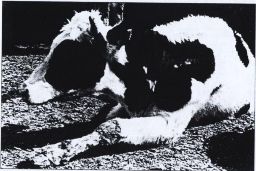
شکل شماره ۳- از علائم نفخ، زمینگیر شدن دام است

نشانه‌های مهم بیماری نفخ، بزرگ شدن شکم و باد کردن سمت چپ شکم حیوان یا هر دو طرف است.