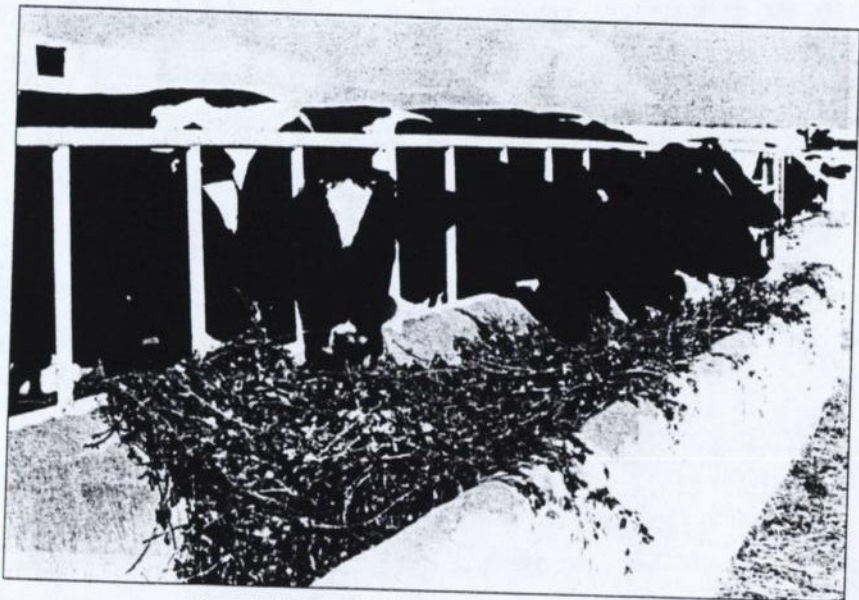
شکل شماره ۲ - ازخوراندن زیاد علوفه و گیاه سبز به دامها پرهیز کنید

چریدن دام روی علف های یخ زده یا شبنم زده در صبح زود باعث به وجود آمدن نفخ خطرناک می شود.