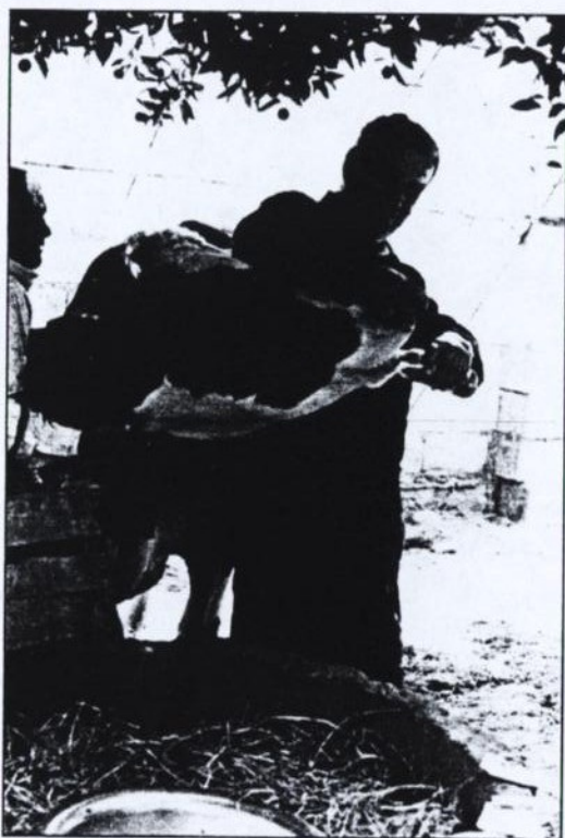
شکل شماره ۷ - خوراندن روغن یا دارو باید توسط دامپزشک یا فرد با تجربه انجام شود تا این کار موجب بروز خفگی در حیوان نشود.

۷. پس از دادن داروهای ضد نفخ به دام، بهتر است پهلوی چپ حیوان را مالش بدهید. با این کار دارو با غذای درون شکمبه مخلوط می شود و زودتر اثر می کند.